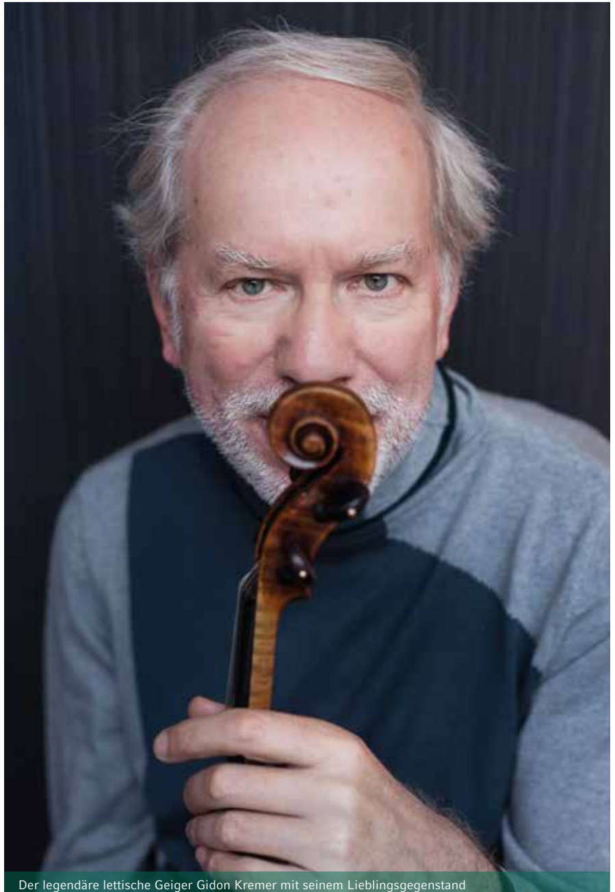
Der legendäre lettische Geiger Gidon Kremer mit seinem Lieblingsgegenstand

Gidon Kremer wurde in Riga (Lettland) geboren und erhielt unter anderem Unterricht bei David Oistrach. 1967 gewann er den Königin-Elisabeth-Wettbewerb und wenig später den ersten Preis des Paganini-Wettbewerbes in Genua sowie den Internationalen Tschaikowsky-Wettbewerb. Kremers Repertoire ist außergewöhnlich groß, beinhaltet neben den klassischen und romantischen Meisterwerken auch die der großen Zeitgenossen wie Sofia Gubaidulina, Gija Kantscheli, Alfred Schnittke, Hans Werner Henze und Karlheinz Stockhausen. Immer wieder bringt