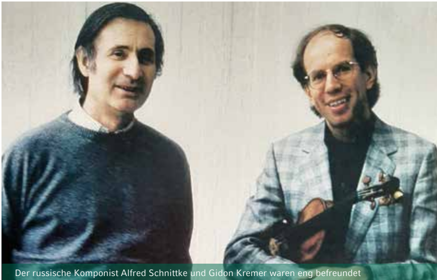
Der russische Komponist Alfred Schnittke und Gidon Kremer waren eng befreundet