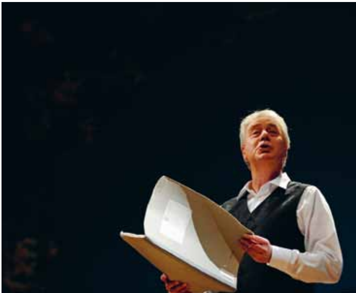
„Peter und der Wolf“, Olaf Bär (Sprecher), Semper Oper Dresden

Man muss diese Geschichte in ihrem Ablauf kaum verändern, und doch kann sie immer wieder anders klingen, anders ausschauen und andere Assoziationen freisetzen. „Peter und der Wolf“ handelt vom Sieg über eine scheinbar stärkere Macht, der man durch Klugheit Herr wird. Sie handelt aber auch von Gewalt. Vom Mord an Peters Freundin, der Ente, und der Gefangennahme des Bösewichts.