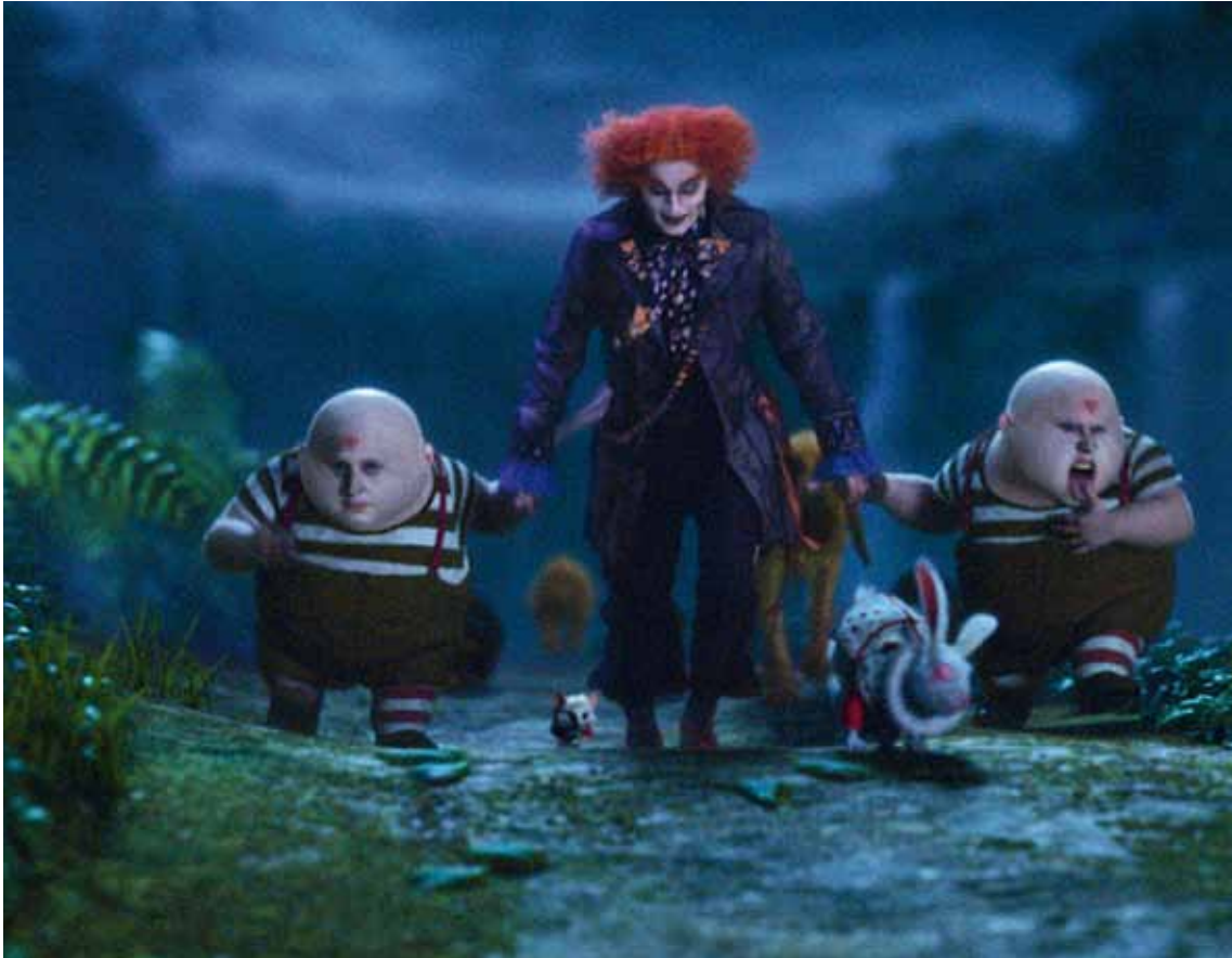
Szene aus dem Film „Alice im Wunderland“