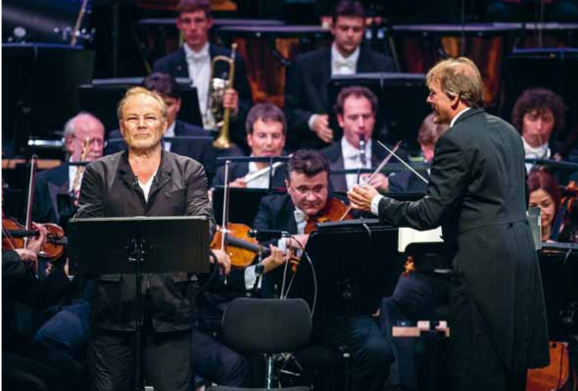
Klaus Maria Brandauer und Thomas Hengelbrock, König der Nacht , SHMF, 2012